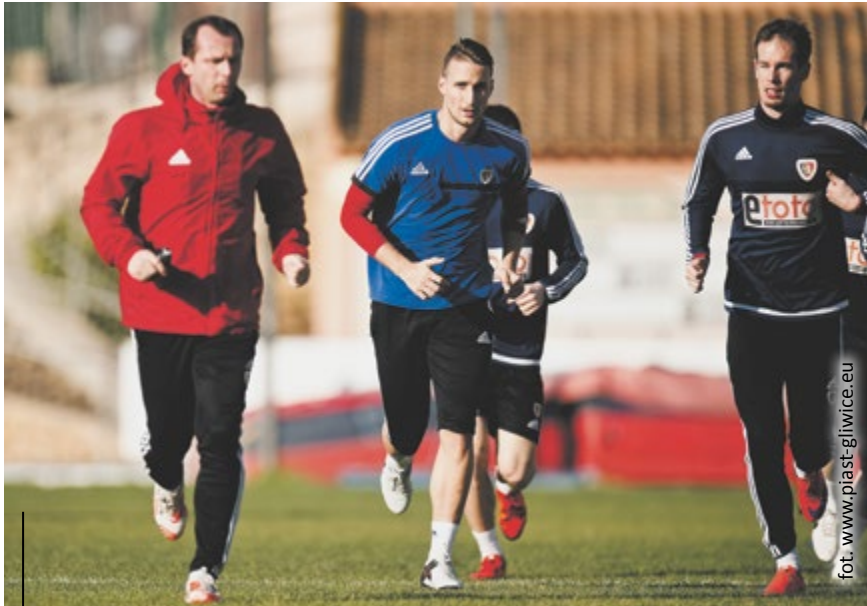
Trener i piłkarze gliwickiego Piasta szlifowali formę m.in. na obozie przygotowawczym w Hiszpanii. Zawodnicy z niecierpliwością czekają na wznowienie rozgrywek