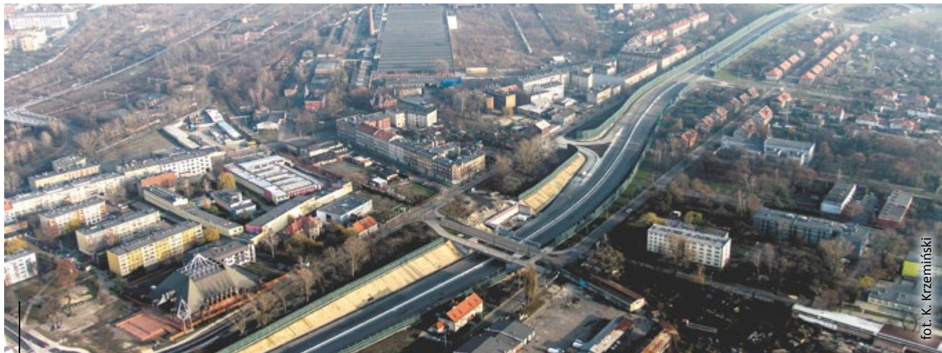
Prace na DTŚ zakończyły się pod koniec 2015 r. Obecnie trwają odbiory techniczne. Wszystko wskazuje na to, że w nocy 20 marca na DTŚ wjadą samochody.

Warto skorzystać z tej sposobności i osobiście sprawdzić, jak wygląda gotowa „średnicówka”. To bardzo dobra okazja, która już nigdy się nie powtórzy, bo po udostępnieniu DTŚ dla ruchu, nikt na piechotę do tunelu