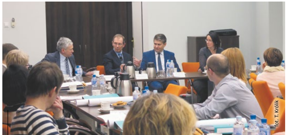
fol. T. Królik

niczący reprezentuje osiedle. Przewodniczący zarządów biorą też udział w cyklicznych spotkaniach z prezydentem i sekretarzem miasta oraz urzędnikami. Podczas tych spotkań otrzymują najświeższe informacje dotyczące życia miasta, m.in. w sprawie budowy DTS, hali Gliwice czy na temat spodziewanych utrudnień i terminów prowadzenia prac czy konkretnych inwestycji. Rady z kolei te informacje przekazują mieszkańcom przy okazji wyjaśniając okoliczności i rozwiewając ewentualne wątpliwości. Ponadto, podczas spotkań z mieszkańcami tłumaczą zawoilości prawne, radzą jak załatwiać sprawy administracyjne. Kontakt z mieszkańcami jest możliwy nie tylko podczas spotkań, ale też poprzez internet i wydawane biuletyny. Pierwsze Rady Osiedli w Gliwicach rozpoczęły swoją działalność w 1991 r. Przez ćwierćwiecze ich działalności, na gliwickich osiedlach sporo się zmieniło. Rady Osiedli organizują m.in. życie kultural-