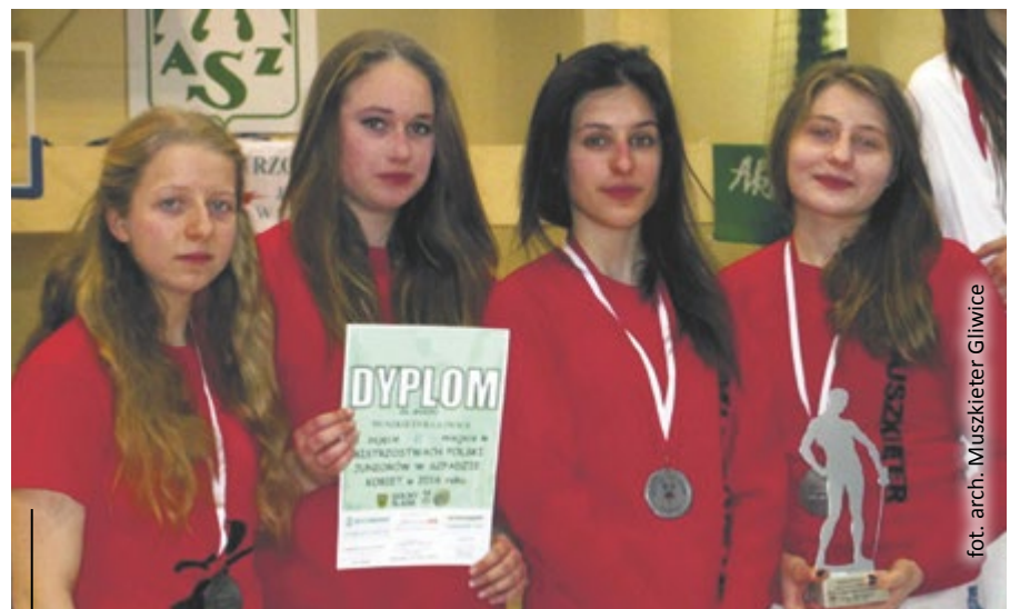
Drużynowe wicemistrzynie Polski! Zawodniczki Muszkietera Gliwice zaprezentowały się bardzo dobrze na mistrzostwach Polski juniorów w szpadzie kobiet i mężczyzn we Wrocławiu