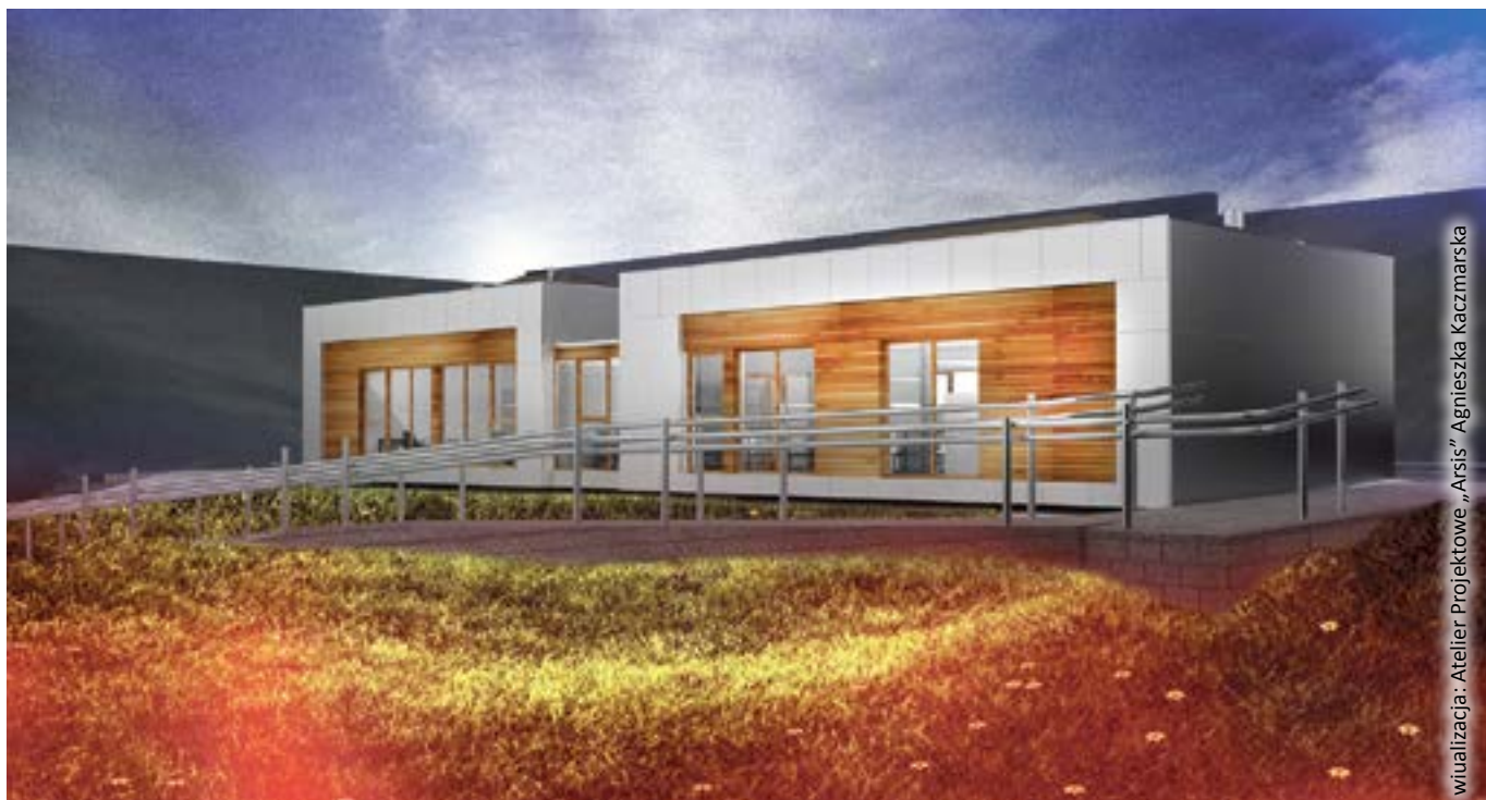
wizualizacja: Atelier Projektowe „Arsis”, Agnieszka Kaczmariska

Jakość usług świadczonych w zakładach nie różni się niczym od zwykłych przedsiębiorstw. Niepełnosprawni mogą dzięki temu udowodnić, że są w pełni wartościowymi pracownikami. Przede wszystkim jednak żyją aktywniej, wychodzą z domu i nie czują się samotni, lecz potrzebni oraz sami zarabiają na swe utrzymanie. Co proponują potencjalnym klientom? Między innymi usługi poligra-