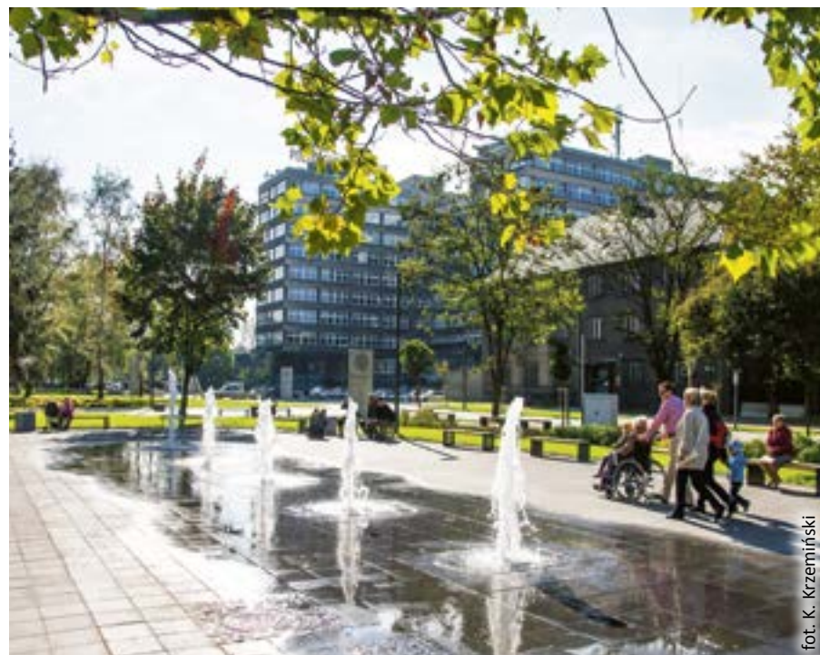
fol. K. Krzemiński

Aby w Gliwicach żyło się wygodniej i bezpieczniej.