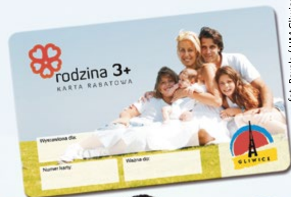
fol. Pixels / UM Gliwice