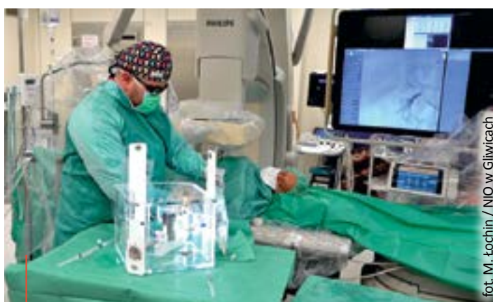
Gliwicki onkolog pierwszy w Polsce walczy z rakiem wątroby mikrosferami z holmem.

Konieczne były m.in. szkolenia wymagane przez producenta preparatu i uzyskanie pozwoleń na użycie tego typu izotopu promieniotwórczego. Poza tym zabieg wymagał warunków pracowni radiologii zabiegowej, użycia cyfrowej angiografii