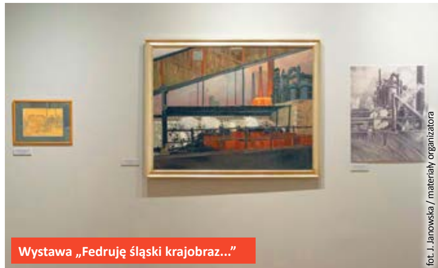
Wystawa „Fedruję śląski krajobraz...”

Druga śląska wystawa prezentowana była w Czytelni Sztuki w Willi Caro. To fotografie Jana Bułhaka. W 1936 roku powstał przekrojowy obraz podróży autora na Śląsk, od górnośląskiego zagłębia