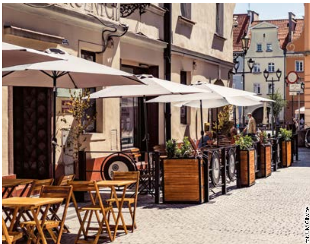
fol. UM Gliwice