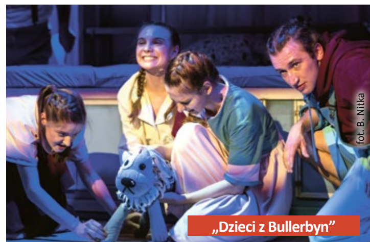
„Dzieci z Bullerbyn”

Teatr Miejski w Gliwicach zdobywa swoją publiczność. W zakończonym sezonie w blisko 200 imprezach wzięło udział około 25 tys. widzów.