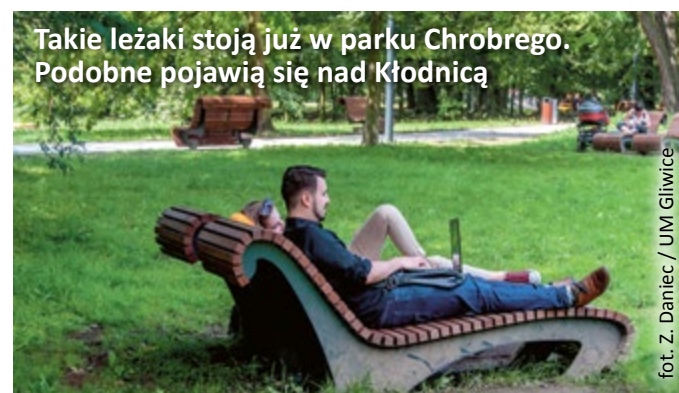
Takie leżaki stoją już w parku Chrobrego. Podobne pojawią się nad Kłodnicą

MZUK planuje na tym terenie zasadzić ponad 1 100 roślin, w tym: klony, platany, wiśnie, krzewy, trawy ozdobne i kwiaty.