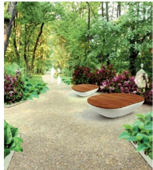
Tak będzie wyglądał park Chrobrego po modernizacji. Za projekt odpowiada Pracownia 44STO we współpracy z Visio Architects and Consultants