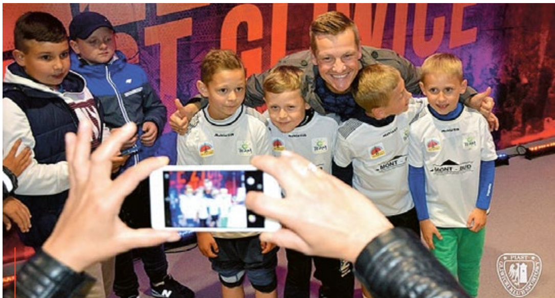
W zbiórce na rzecz hospicjum włączyły się także gwiazdy, które wraz z samorządowcami rozegrały XVI Mecz Gwiazd im. Henryka Bałuszyńskiego

Za nami już Spartakiada Przedzszkolaka, piknik rodzinny oraz XVI Mecz Gwiazd im. Henryka Bałuszyńskiego, występy zespołów Salake i Chrząszcze, animacje i wydarzenia w Młodzieżowym Domu Kultury oraz Gimnazjum nr 1 im. S. Batorego. Co przed nami? 22 czerwca odbędzie się Akademia Małego Hotelarza w Qubus Hotel Gliwice, 23 czerwca w CH FORUM szykują się warsztaty, gra terenowa i spektakl, a 24 czerwca – bieg charytatywny „Kilometry dla hospicjum” (godz. 10.00), piknik rodzinny (Stadion Miejski, godz. 12.00). Kulminacją będzie koncert zespołu Myslovitz na Stadionie Miejskim (24 czerwca, godz. 20.00). Występ poprzedzą koncerty grup Canis Latrans (17.30) i Wyrwani (18.30).