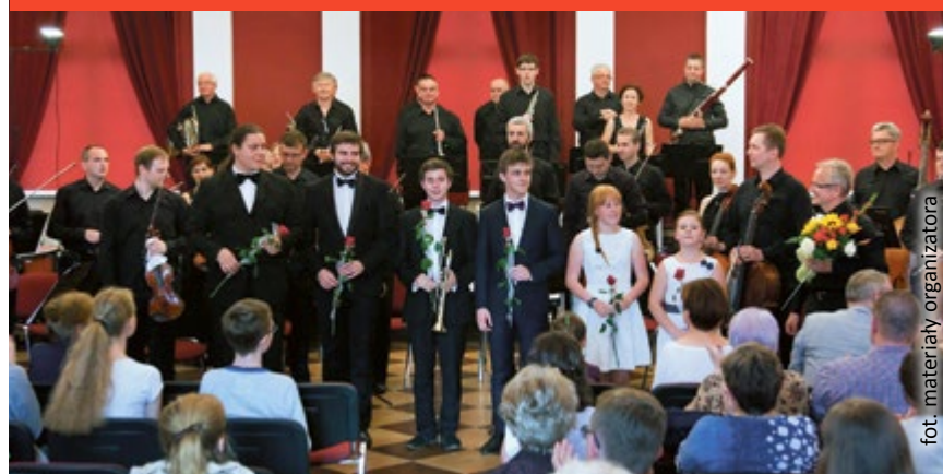
fol. materiały organizatora

25 czerwca Gliwicka Orkiestra Kameralna poszerzy swój skład o młodych, zdolnych muzyków. Na koncercie z cyklu „Estrada Młodych” wystąpią uczniowie Państwowej Szkoły Muzycznej im. L. Różyckiego.