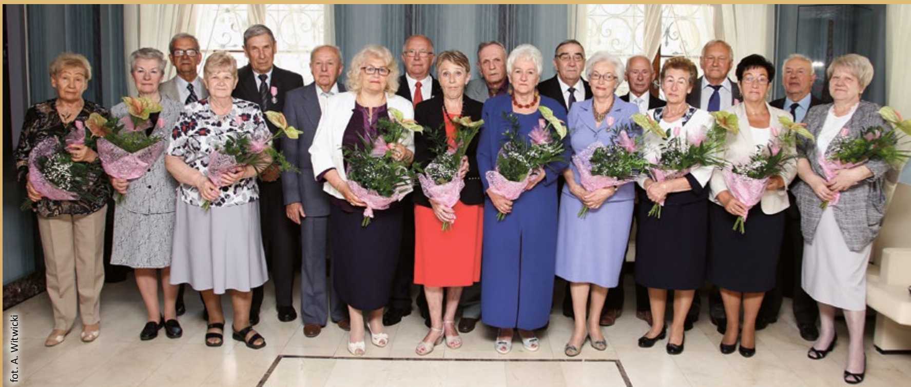
fol. A. Włtwicki