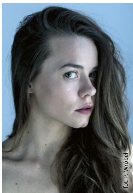
fol. P. Wróbel

Przedstawienie wchodzi na afisz w Teatrze Miejskim (ul. Nowy Świat 55–57) 22 czerwca o godz. 19.00.