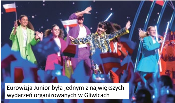
Eurowizja Junior była jednym z największych wydarzeń organizowanych w Gliwicach

Ponad pół miliona odwiedzających – takim wynikiem Arena Gliwice zamyka dwulecie swojej działalności. Średnio co trzy dni ciekawe wydarzenie, a kalendarz ostatnich miesięcy wypełniły imprezy sportowe, rodzinne i muzyczne. Dziękujemy, że byliście z nami!