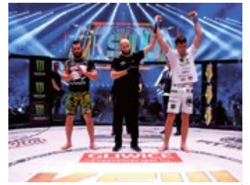
Gale sportów walki – w tym KSW 52 The Race – oglądał w Arenie komplet publiczności

To był czas wielkich wydarzeń, który spędziliśmy wspólnie. Cze-