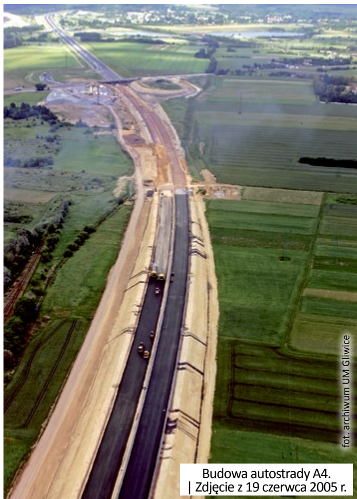
Budowa autostrady A4. | Zdjęcie z 19 czerwca 2005 r.