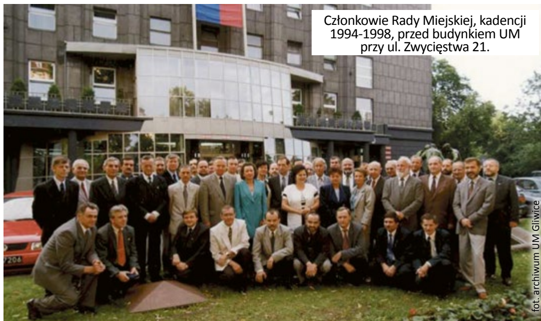
Członkowie Rady Miejskiej, kadencji 1994-1998, przed budynkiem UM przy ul. Zwycięstwa 21.