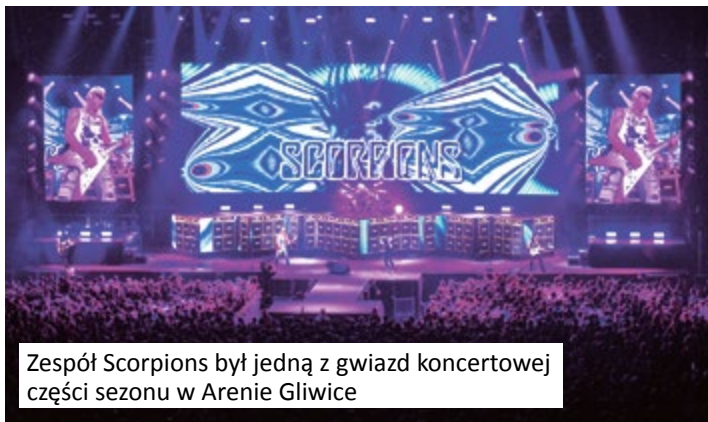
Zespół Scorpions był jedną z gwiazd koncertowej części sezonu w Arenie Gliwice

Widowiskiem, które odbiło się największym echem, był listopadowy finał konkursu Eurowizji Junior. Transmitowana na cały świat impreza okazała się sukcesem frekwencyjnym i organizacyjnym. Ale nie tylko Eurowizją Junior żyła w ostatnich miesiącach gliwicka arena. Dobra