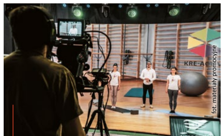
Scena urodzin online Areny Gliwice ustawiona jest w reprezentacyjnym holu C.