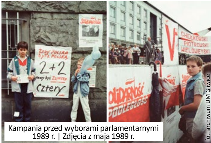
Kampania przed wyborami parlamentarnymi 1989 r. | Zdjęcia z maja 1989 r.

Na mocy tej ustawy pierwsze, w pełni demokratyczne wybory samorządowe wyznaczono na 27 maja 1990 roku. W małych jednostkach terytorialnych przyjęto zasadę głosowania