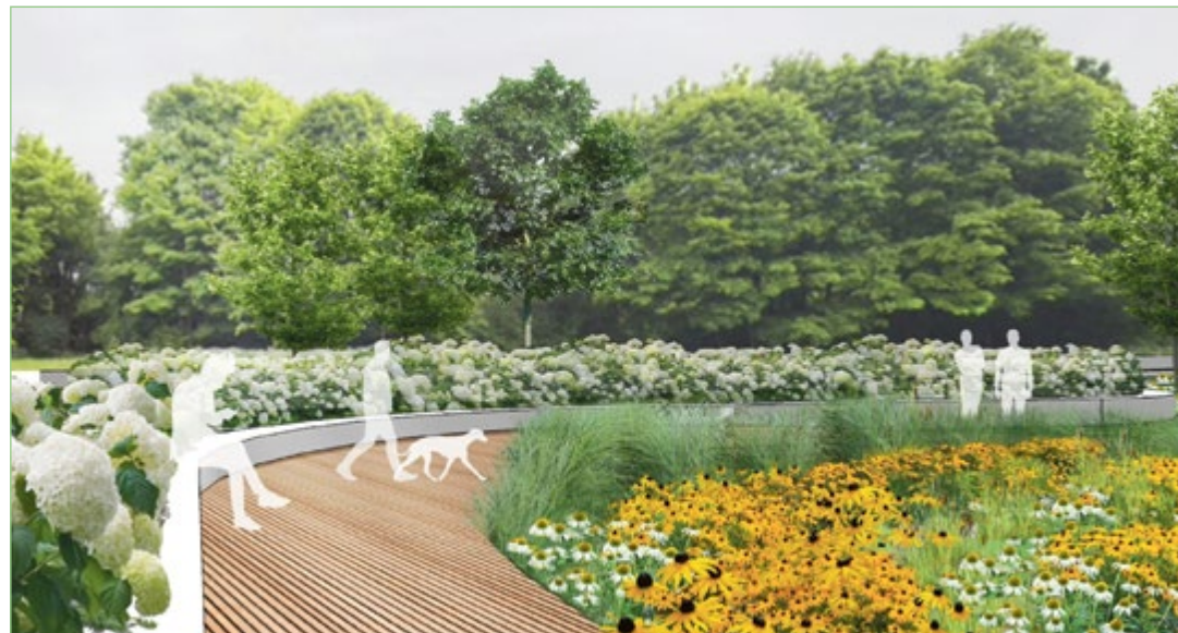
Widok na podest oraz niski murek w rabatach

Wokół zaplanowano dużo zieleni. Zadbano o cenne drzewa rosnące na łąkach, mają pojawić się też nowe drzewa, krzewy ozdobne, łąki kwietne, trawniki, ścieżki, a wycinki zostaną ograniczone do koniecznego minimum. Zachowana zostanie aleja lipowa nad Ostropką, która będzie odnowiona i oświetlona.