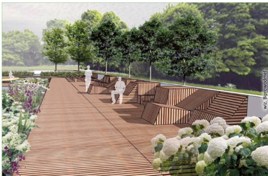
Widok na łoże i podest wielofunkcyjny

Koncepcja po przeanalizowaniu kolejnych uwag, w tym opinii mieszkańców, skierowana zostanie do dalszego dopracowania podczas projektowania. (al)