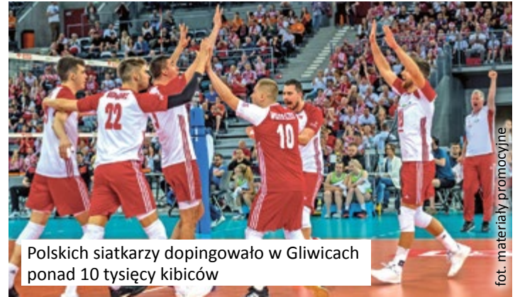
Polskich siatkarzy dopingowało w Gliwicach ponad 10 tysięcy kibiców

Nie zabrakło wielkiego sportu, warto wspomnieć chociażby mecze trzech reprezentacji Polski, rywalizujących z drużynami zza naszej zachodniej granicy – mowa o koszykarzach, piłkarzach ręcznych i siatkarzach. Do tego ważne mecze ligowe basketu, siatkówki i futsalu, a także zmagania biegaczy w Runmageddonie oraz gale sportów walki KSW 52 The Race z udziałem najlepszych wojowników w Polsce.