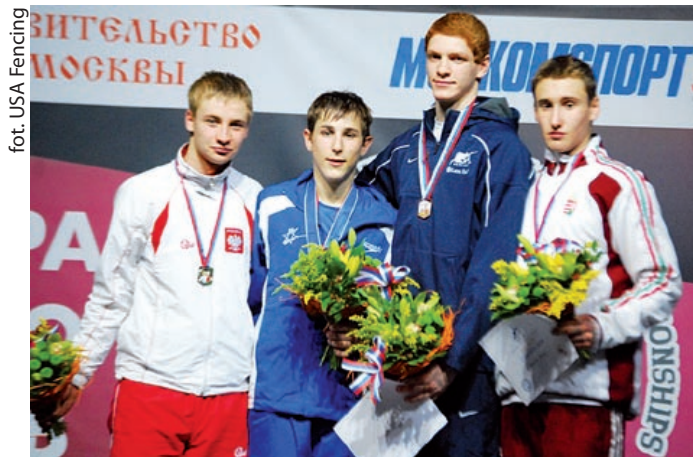
fol. USA Fencing

Uroczyste otwarcie mariny w porcie gliwickim (ul. Portowa 28) przewidziano 28 kwietnia około godz. 12.00. Tego dnia rodzice dzieci do lat 12 mogą liczyć na bezpłatne rejsy swoich pociech po porcie (co pół godziny, od południa do godz. 16.00). (kik)