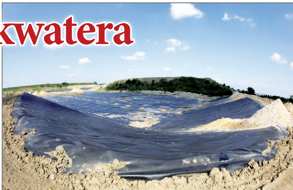
Kwatera zapelni się odpadami po upływie co najmniej 5 lat

W rejonie zrehabilitowanej części składowiska można czasami zaobserwować bażanty i kuropatwy, a niekiedy nawet i zajacę.