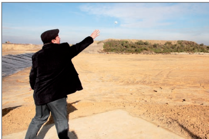
Pierwszy kawałek papieru został wrzucony do nowej komory

Usuwanie odorów (przykrych zapachów) i wykorzystywanie tzw. odcieków do ponownego nawadniania składowiska będzie nadal – jak się dowiedzieliśmy – jednym z najważniejszych zadań gospodarzy obiektu przy ul. Rybnickiej. Deklarują oni również chęć systematycznego sadzenia krzewów i drzew w celu tworzenia naturalnego zielonego ekranu pomiędzy wysypiskiem a skupiskami ludzkimi. Dotychczasowe wysiłki przyniosły już pewne efekty.