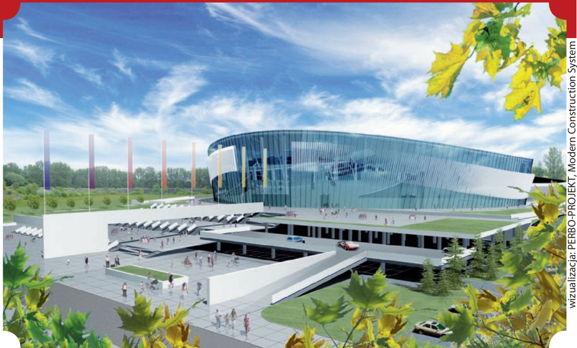
wizualizacja: PERBO-PROJEKT, Modern Construction System

Hala widowiskowo-sportowa PODIUM dla 15 tys. widzów ma powstać za 4 lata w miejscu dawnego stadionu XX-lecia. Budowa rozpocznie się w 2011 r. Inwestycja została uznana przez zarząd województwa za jeden z trzech największych i najważniejszych dla regionu projektów. Szacunkowy koszt to 365 mln zł. Z tego około 141 mln zł gliwicki samorząd chce pozyskać z Unii Europejskiej. Pod koniec grudnia Komisja Europejska w Brukseli ma podjąć ostateczną decyzję pieczętującą przyznanie unijnego dofinansowania. W przyszłości w PODIUM będą organizowane koncerty i imprezy sportowe w różnych dyscyplinach o randze mistrzostw świata czy Europy.