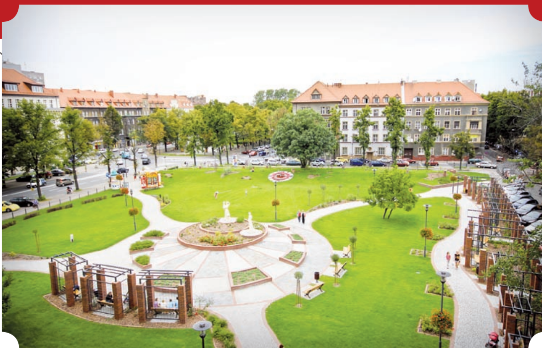
fol. A. Ziaja

Już ponad 450 ha powierzchni Gliwic zajmują parki, skwery i zieleńce. Gruntownie modernizowane i porządkowane, służą wypoczynkowi i aktywnej rekreacji mieszkańców. W ostatnich latach przebudowano m.in. Plac Grunwaldzki, skwer Dessau u zbiegu ulic Jana Pawła II i Nowy Świat, odnowiono też skwer Doncaster położony w centrum miasta. W tym roku nowe oblicze zyskał skwer Bottrop (w sąsiedztwie Szkoły Muzycznej i ul. Młyńskiej), place Mickiewicza i Rzeźniczy (obok kościoła pw. Wszystkich Świętych). Miejski Zarząd Usług Komunalnych – odpowiedzialny za utrzymanie zielonych połaci miasta – stawia też w różnych częściach Gliwic oryginalne konstrukcje kwiatowe, uatrakcyjnając w ten sposób wizerunek poszczególnych dzielnic.