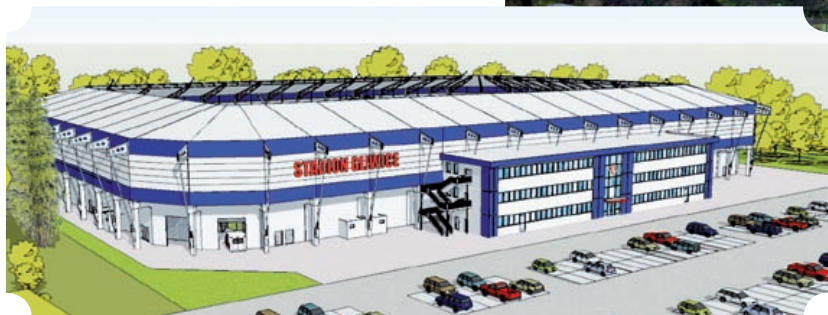
wizualizacja: BREMER AG

większenie widowni o kolejne 5 tys. miejsc). Murawa będzie podgrzewana, a nowe oświetlenie będzie dostosowane do transmisji telewizyjnych w technologii HD. Budowa ma kosztować około 54 mln zł wyasygnowanych z budżetu miejskiego. Pierwszy mecz na nowym stadionie zostanie rozegrany jesienią przyszłego roku.