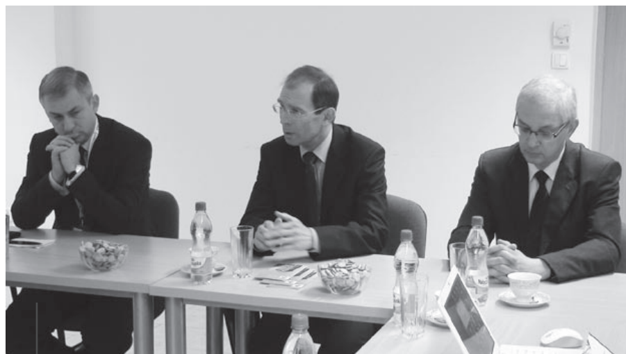
fol. t. Fedorczyk

– Mamy się czym pochwalić i – co więcej – potrafimy powiedzieć, jak i dlaczego do tego doszliśmy. Na pewno też umiemy pokazać – i to jest rzecz bardzo wielka! – że Gliwice przewodzą w wielu obszarach, które dla naszej komisji są szczególnie ważne – nie ukrywał satysfakcji prof. Kaźmierczak.